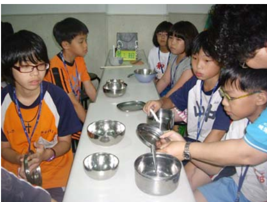
兒童營學員午齋用膳一景