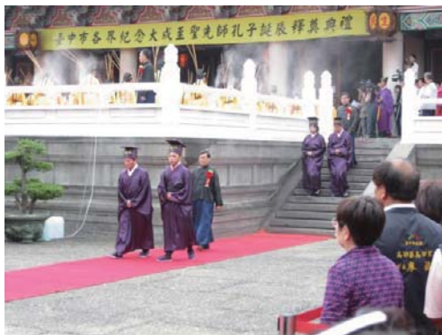
初獻禮畢。分獻官下大成殿，正獻官留在殿上。