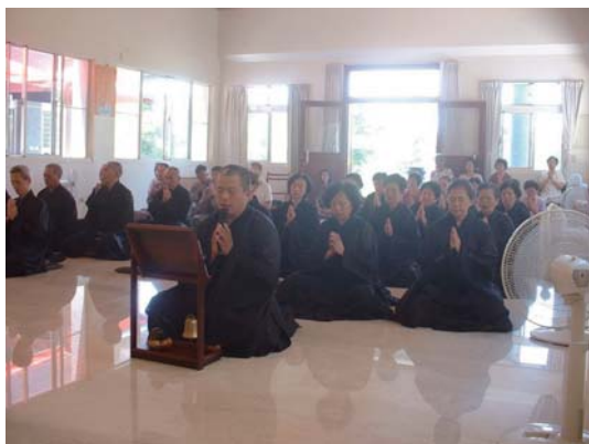
大眾座念觀世音菩薩聖號