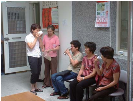
法會結束休憩一景