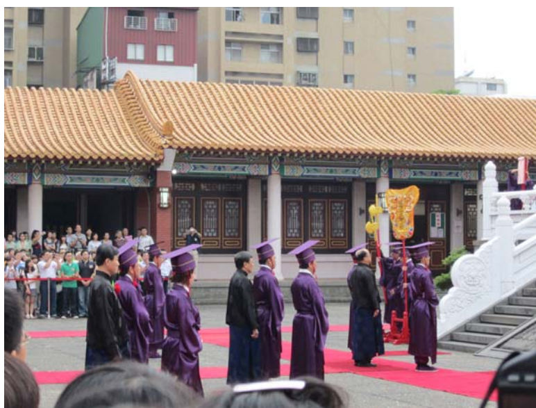
正獻官、分獻官及陪祭官就位完畢

本性這一課，最主要是幫助我們破除迷惑及開悟。學佛並非是神秘的事，只是要學習將我們