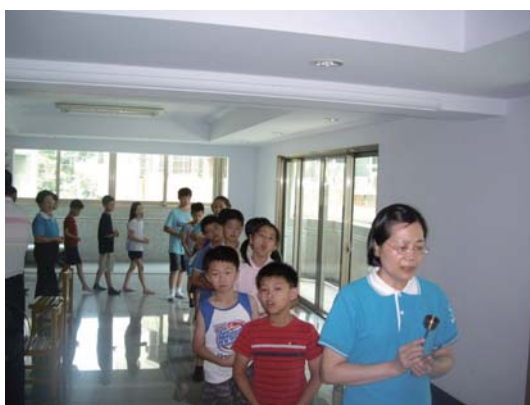
兒童班小朋友午齋完畢經行攝心