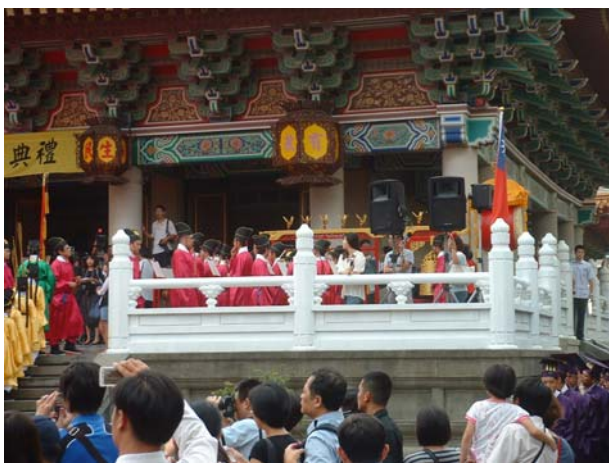
樂生在大成殿前東側集合完畢

始，第十地是十地的終了。由初地到十地，其中種種不同的修持經歷，都要明白，都要證得。修道者是初地不知二地的境界，十地不知等覺的境界。各人的境界，各自不同。修道者的功夫、法