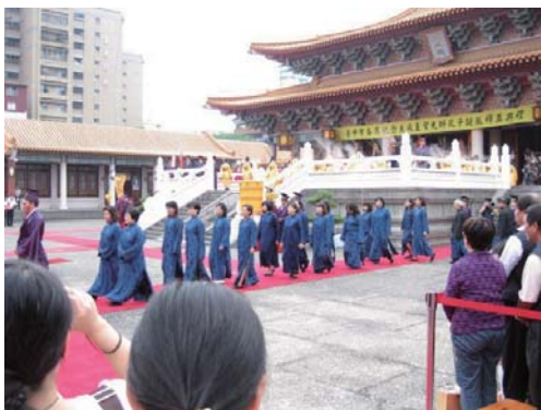
陪祭官由各界賢達人士擔任