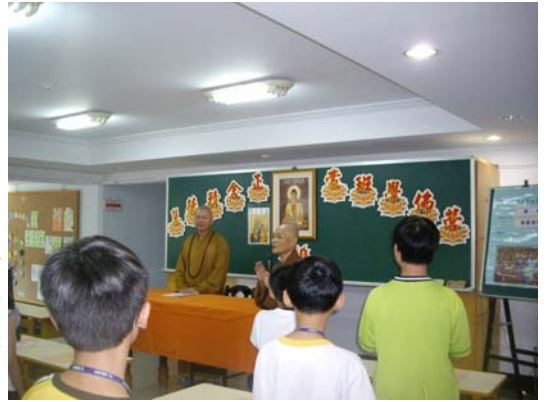
彰化佛教會理事長致詞