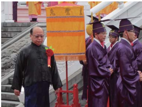
初獻禮。正獻官登大成殿。