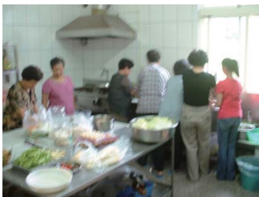
廚房義工菩薩準備午供及午齋