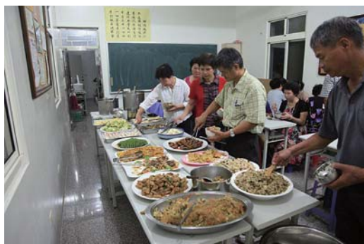
一人一菜聯誼聚餐