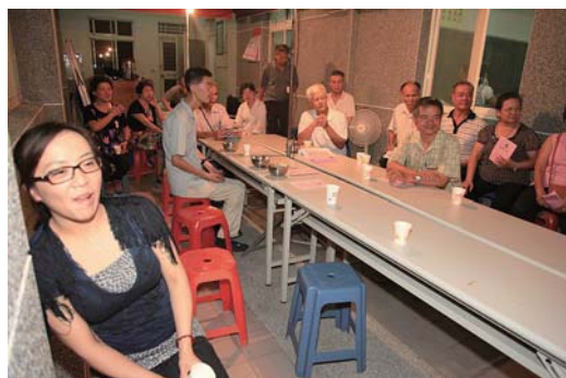
賞月乘涼觀賞表演節目