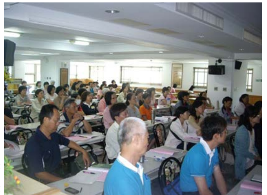
教師營學員上課一景