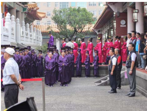
執事者在東廡集合預備入場