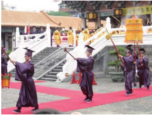
迎神。迎請孔子神位。執事者由東西兩側出大成門。