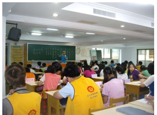
兒童營學員上課一景