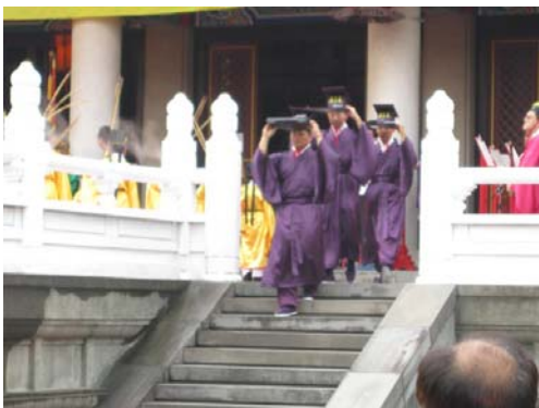
捧祝帛詣燎所。執事者將祝文和玉帛捧出大成門外焚燒。