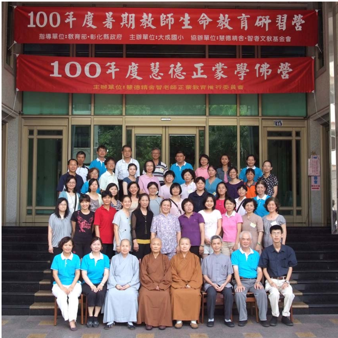
一〇〇年度暑期教師生命教育研習營暨 慧德正蒙學佛營 100年7月1日~7月3日