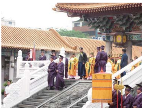
馬總統親臨上香致意。