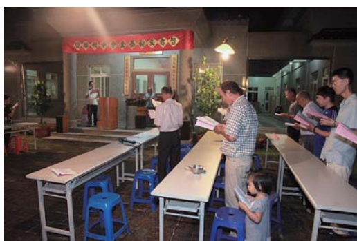
全體連友唱誦智者之歌