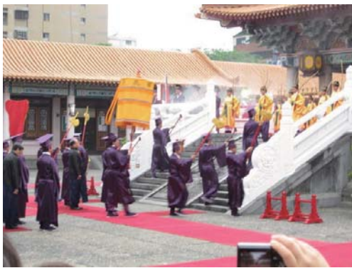
返回時由中央走道進入。