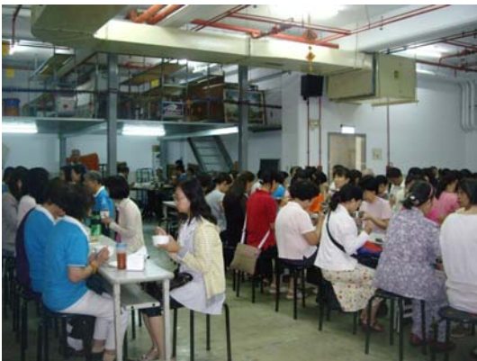
教師營學員午齋用膳一景