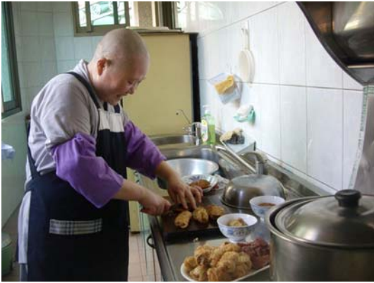
大寮師父準備午齋