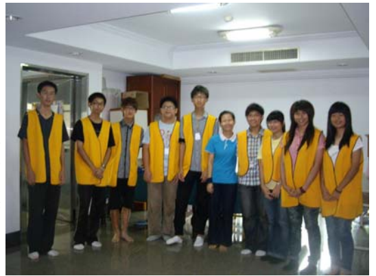
兒童營小隊輔由前屆已畢業學長姐擔任