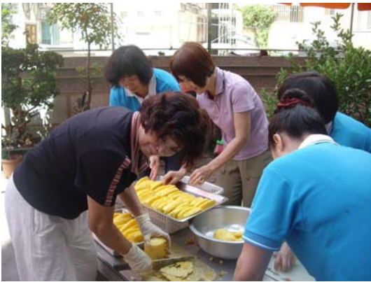
義工菩薩協助上菜流程