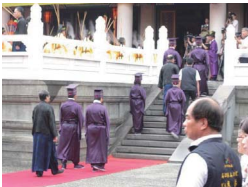
分獻官部分登大成殿，部分進入東、西廡孔子門人神位前獻祭。