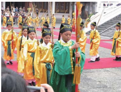
全體佾生於大成殿前留影。