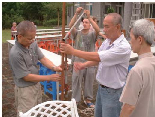
工作人員佈置場地