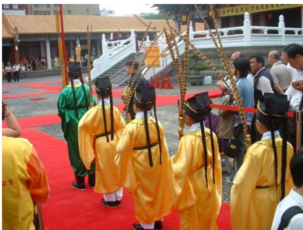
力行國小僧生入場