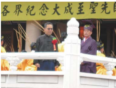
民政處長擔任糾儀官