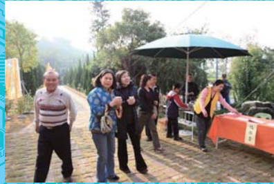
歷屆董事回娘家了