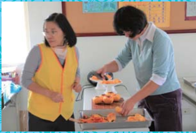
招待組供養“養生茶”