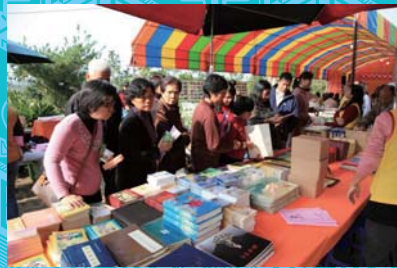
“智者的書”廣結法緣