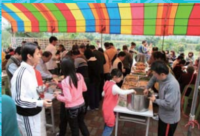
快樂幸福的聚餐～福氣啦