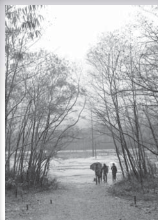
日本上高地・大正池