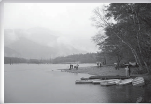
●●● 日本上高地・大正池

真就留了十年。可見修行人有如此的工夫，自己何時往生是很自在的，而這種的結果是因為前面的因和緣所促成的。所以整個佛教所說的因緣果報是真理，也是一種教育。可惜的是，現在人把因果當成迷信，當作勸世人為善的宗教。我們指望大環境會有所改善，應該先對自己的子弟加強建立因緣果的觀念，那他們無論在何處都不會做壞事，因為他