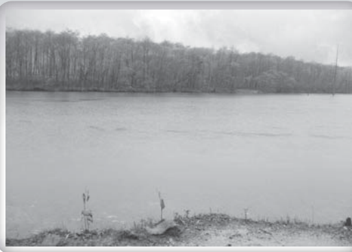
日本上高地・大正池

到什麼好處，也是白想，所以就老實不想，心裡也就沒有什麼妄念了。 雲谷禪師 笑道：我本來以為你是一個了不得的豪傑，哪裡知道，你原來也只是一位庸庸碌碌、相信命運的凡夫俗子。不過，既然他有如此的定力及善根， 雲谷禪師 就順著他的根機開導。 雲谷禪師 說道：一個平常人，既然有這一顆一刻不停的妄心在，那就要被陰陽氣數束縛了；既被陰陽氣數束縛，怎麼可說沒有定數呢？雖說數一定有，但是只有平常