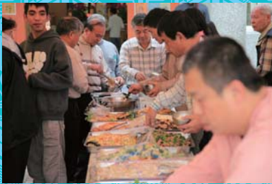
自助式午齋～自己來啦