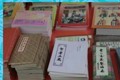
本會印贈圖書一角