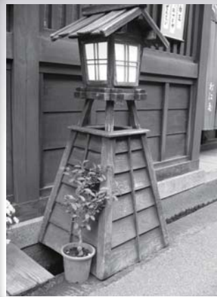
上三古町街燈

例如禪宗，不依文字、直指人心、見性成佛是也。天台宗分成四教「藏通別圓」，沒有這個頓教。到了賢首宗，分成五教，加了個頓教。不是天台智者大師的智慧不夠，因為智者大師是南北朝的人，後來到隋朝，他圓寂在隋朝，他沒有到唐朝。禪宗是大興於唐朝，開始是達摩初祖在南北朝梁武帝時進入中國的，然後到河南嵩山少林寺面壁九年，這法沒有傳開，後來傳給了二祖，二祖傳三祖、三祖傳四祖、四祖傳五祖，頓教根本沒有傳開，一直傳到六祖慧能大師，才從五祖那兒得到了法，然後到曹溪大弘頓教。判教就依文字判，依著釋迦佛說法49年的道理做根據。小乘教依著《阿含經》做根據，大乘教依著唯識法相宗做根據。