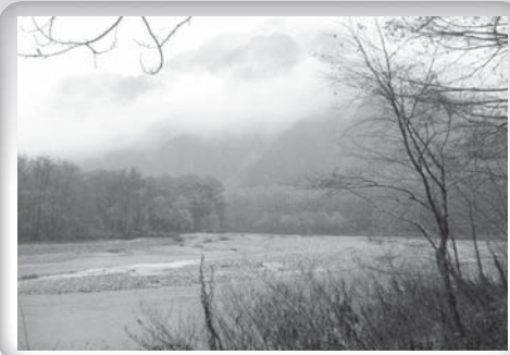
日本上高地・大正池

佛弟子，可不可以像我這樣，用盂蘭盆的方法來救七世父母呢？佛言：「大善快問！我正欲說，汝今復問。」佛說，你問得好啊！我正想要說，你就問了。佛本來就要利益眾生的，有這因緣，他當然要說。「若有比丘、比丘尼，國王、太子、大臣、宰相，三公、百官，萬民、庶人」，以上所舉的這些人，他們通通都沒有辦法救度自己的父母，尤其是救度已經墮落在餓鬼道的眾生。即使貴為王公大臣、貴為國王宰相，也沒