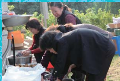
忙碌的香積組～洗菜族