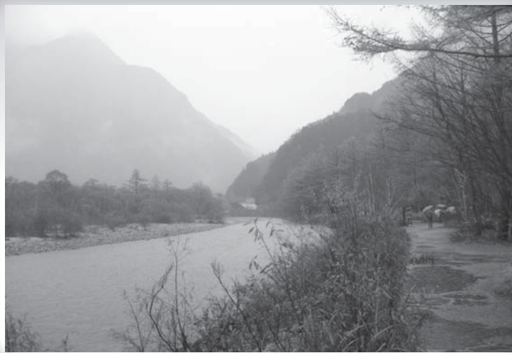
●●● 日本上高地・大正池