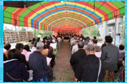
大眾聆聽“智者之歌”