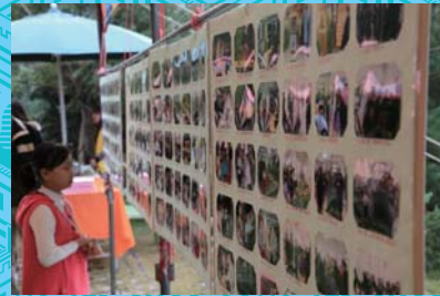
歷年活動照片看板