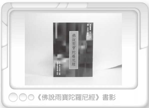
《佛說雨寶陀羅尼經》書影

密教依此經，立寶生如來、持世菩薩為本尊，修祈福法，名「雨寶陀羅尼法」。本陀羅尼計六十一句，左邊加直線之字須合讀。時臻末法，有居士眾等，悲眾生貧疾障重，特為倡印，並囑推廣，因贅數語，供養有緣云。