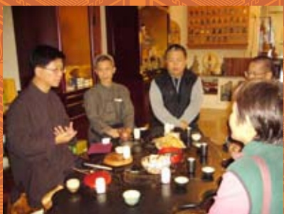
富鉢雕刻參訪座談