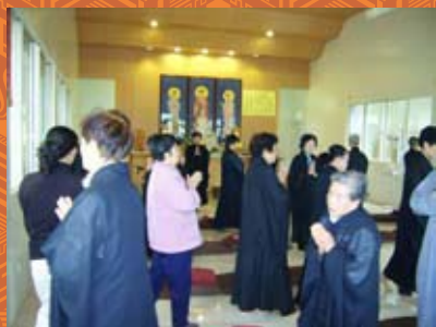
繞佛一步步踩蓮花