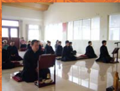
念佛一人在花中坐