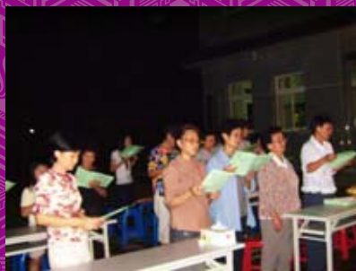
唱「三寶歌」揭開序幕