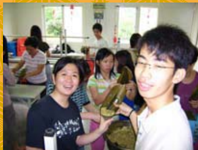
我們會裝填餡料了