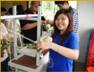
二條粽繩綁比較牢