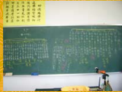
脈絡分析及解說之一