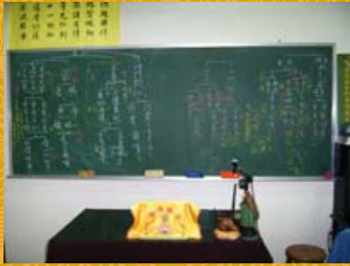
脈絡分析及解說之二