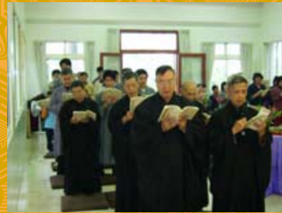
黃董事長領眾共修