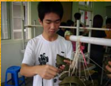
到底要前繞還是後繞